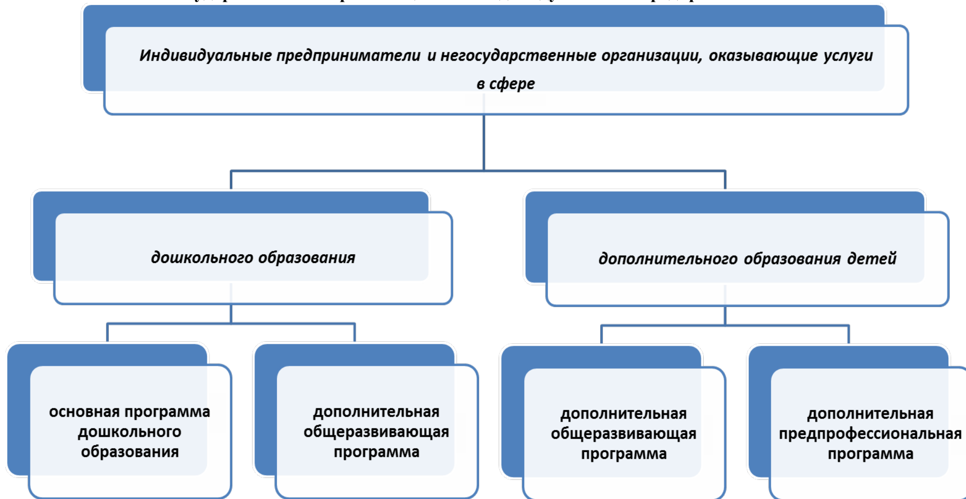
Схема реализации образовательных программ негосударственными организациями и индивидуальными предпринимателями