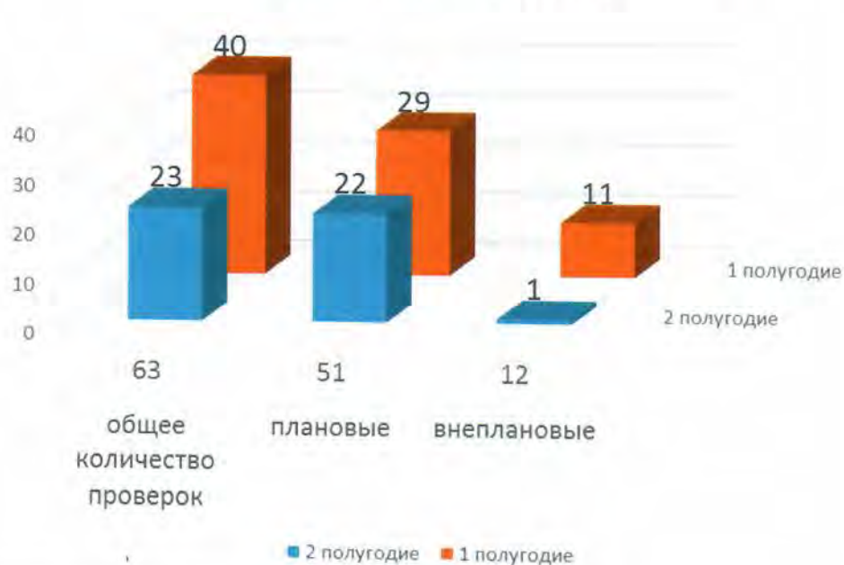
Структура проверок, проведенных в рамках государственного контроля (надзора) в 2018 году (в т.ч. по полугодиям)

В сравнении с 2017 г. количество проверок незначительно сократилось в связи с необходимостью достижения установленных целевых показателей - 20% от всех имеющихся объектов проверок и новыми подходами к планированию контрольной деятельности.