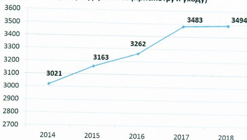
Численность детей в возрасте до 3х лет, получающих услуги по дошкольному образованию и (или) содержанию (присмотру и уходу)